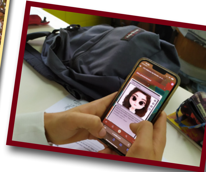
Projeto eTwinning Sabores de Mundo