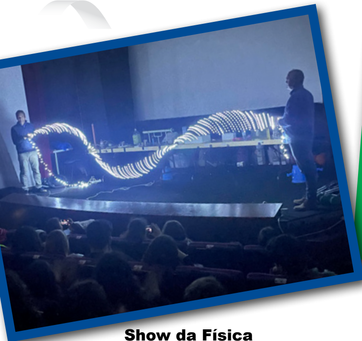
Show da Física