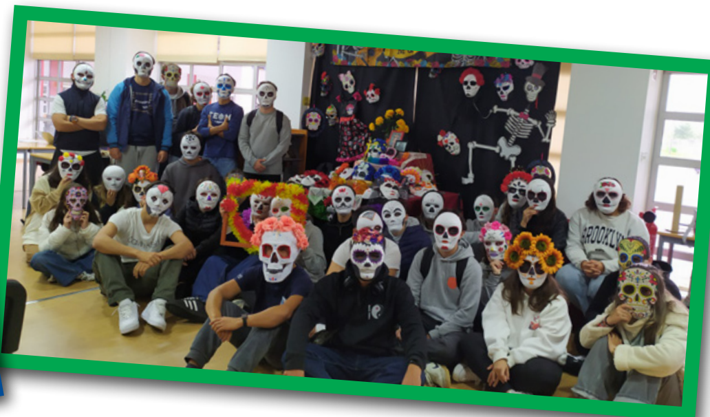
Dia de los Muertos