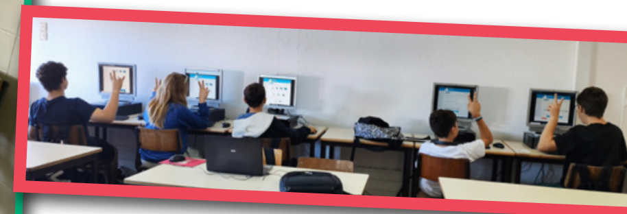
Bebras – Desafio Internacional Pensamento Computacional