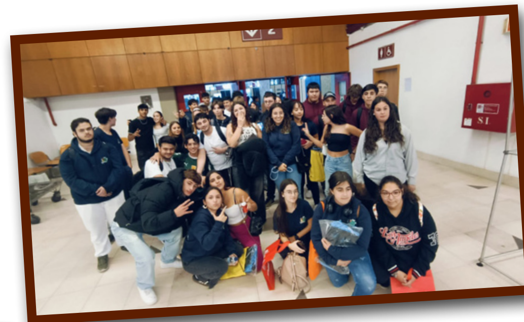
Feira Exponor Concreta VE