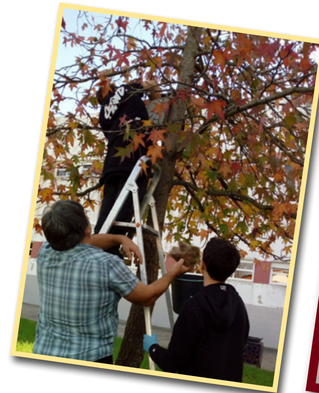
Limpeza de ninhos