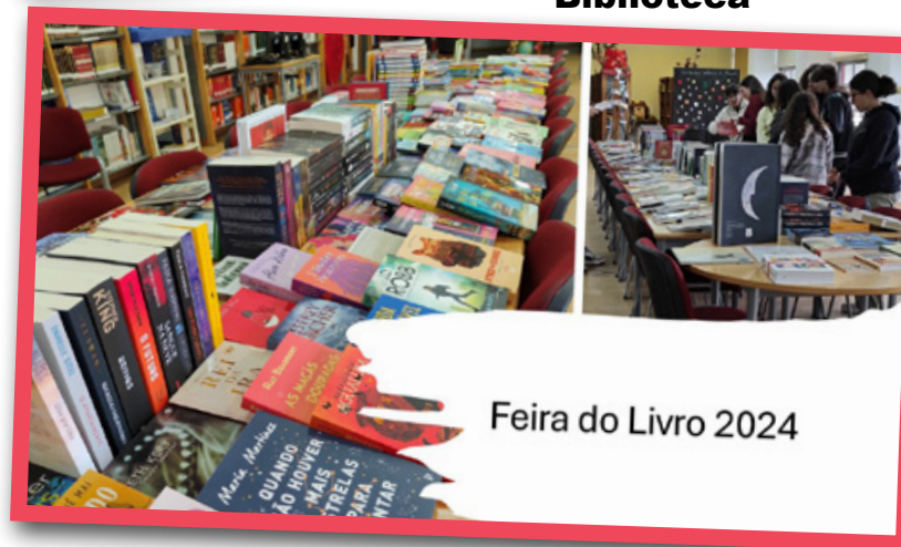
Feira do Livro 2024