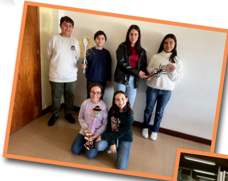
Prémios do Halloween