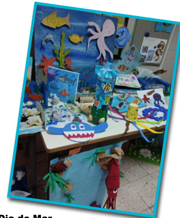
Dia do Mar