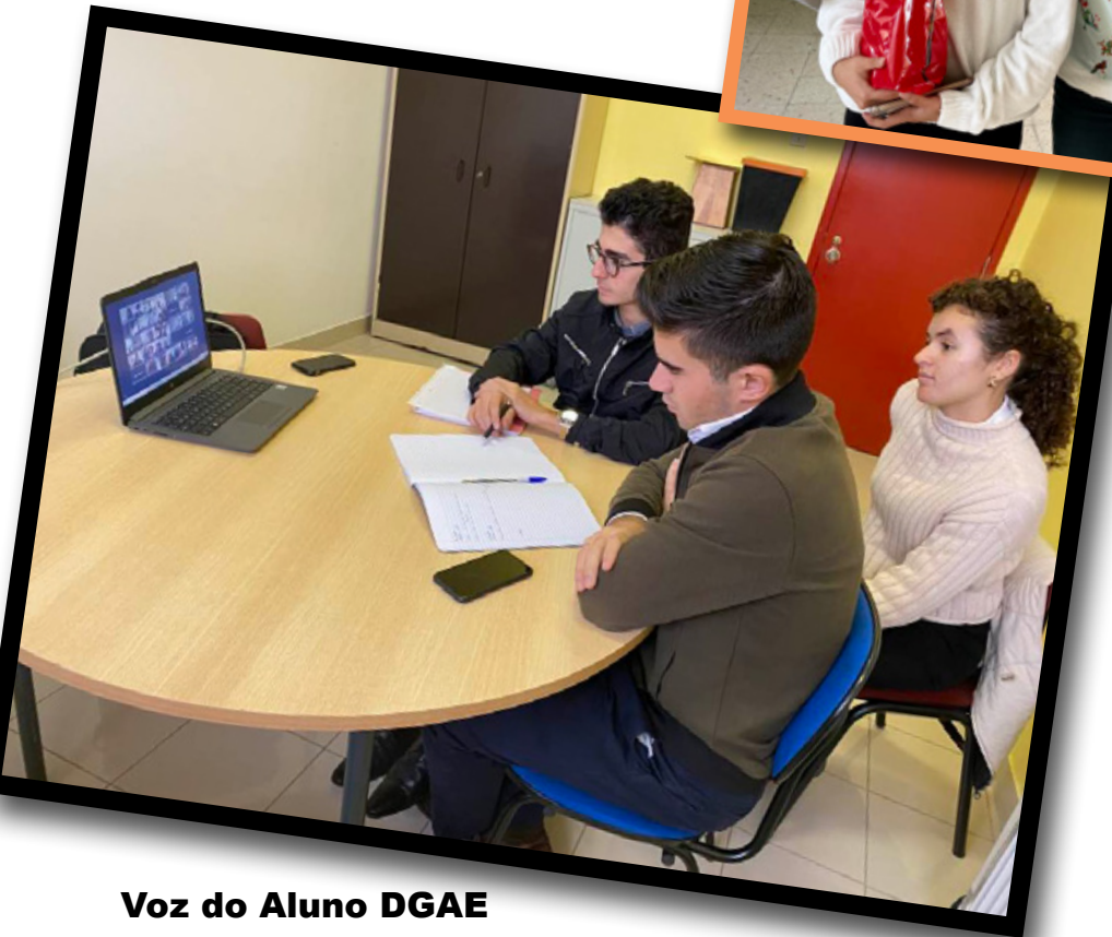
Voz do Aluno DGAE