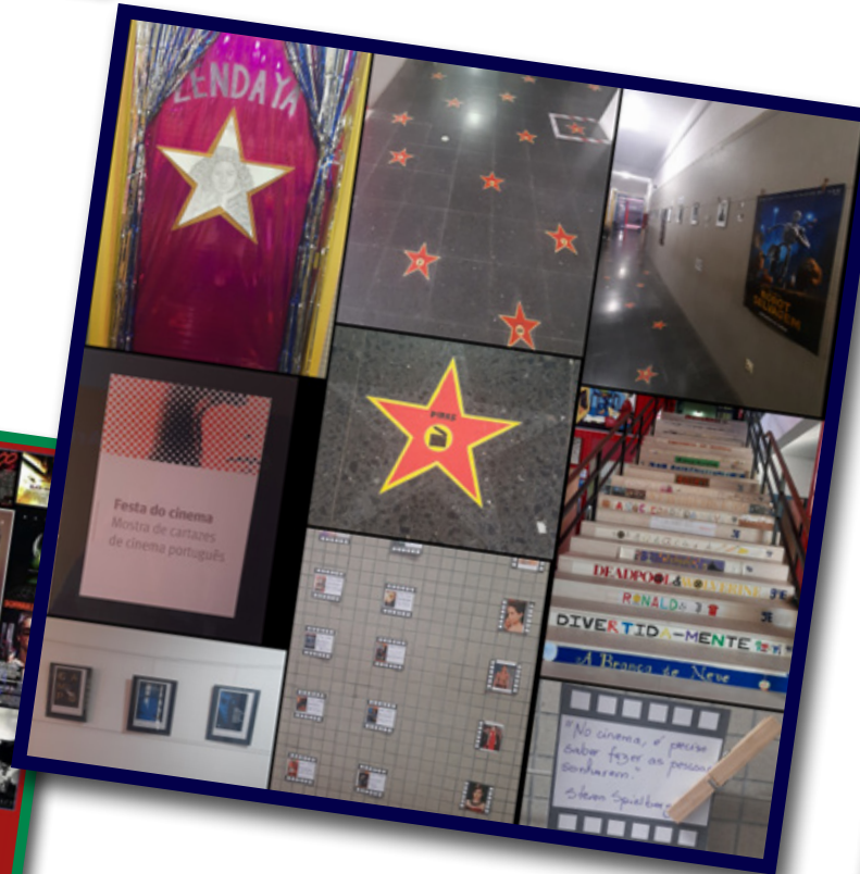
Festa do Cinema