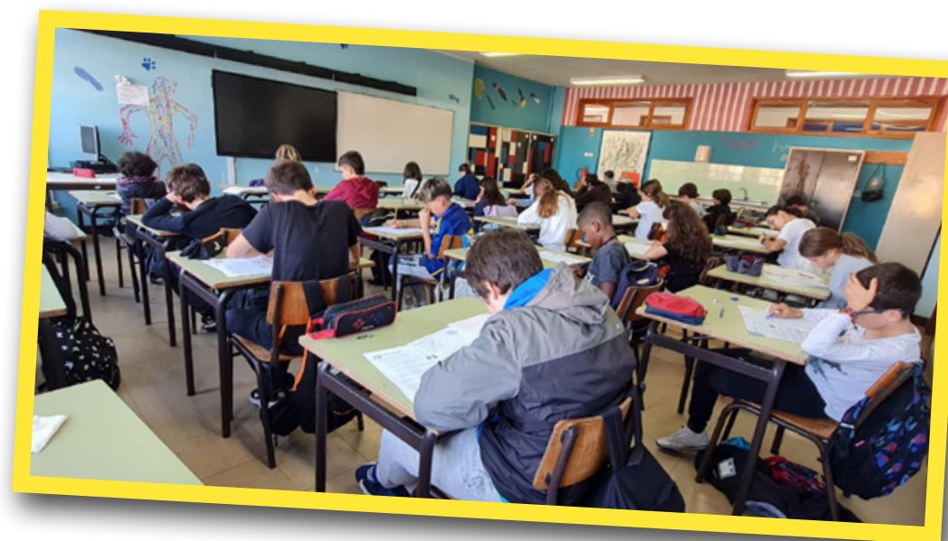
Olimpíadas da Matemática