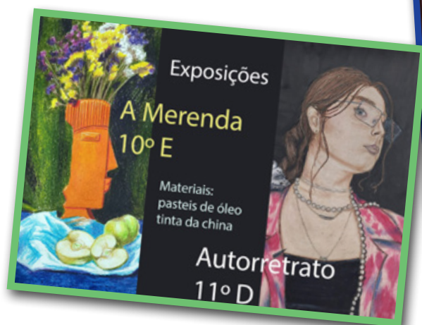
Exposição de Autorretratos