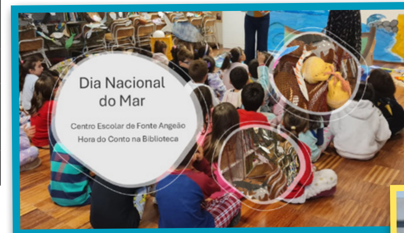
Dia Nacional do Mar

Centro Escolar de Fonte Angeão Hora do Conto na Biblioteca