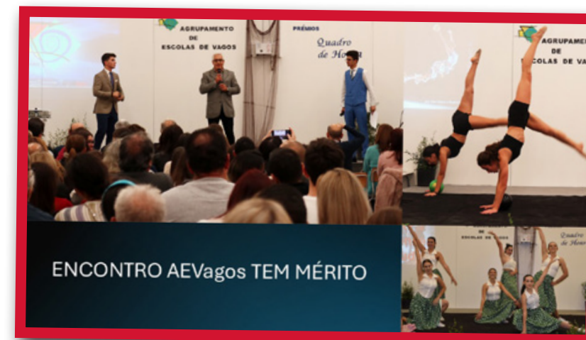
ENCONTRO AEVagos TEM MÉRITO