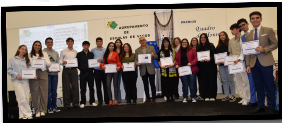
Quadros de Honra